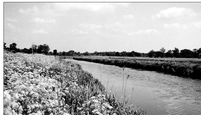
Die fruchtbaren Pinnauwiesen und die Verkehrsverbindung waren entscheidende Faktoren bei der Ansiedlung des Urdorfes Esingen.

Grundriss des Esinger Hofes Nr. 23, der Brinkkate in der Esinger Kaffeetwiete, angefertigt von dem Chronisten Christian Wegener bereits nach dem Abbruch des Hauses 1933. Tier und Mensch lebten unter einem Dach.