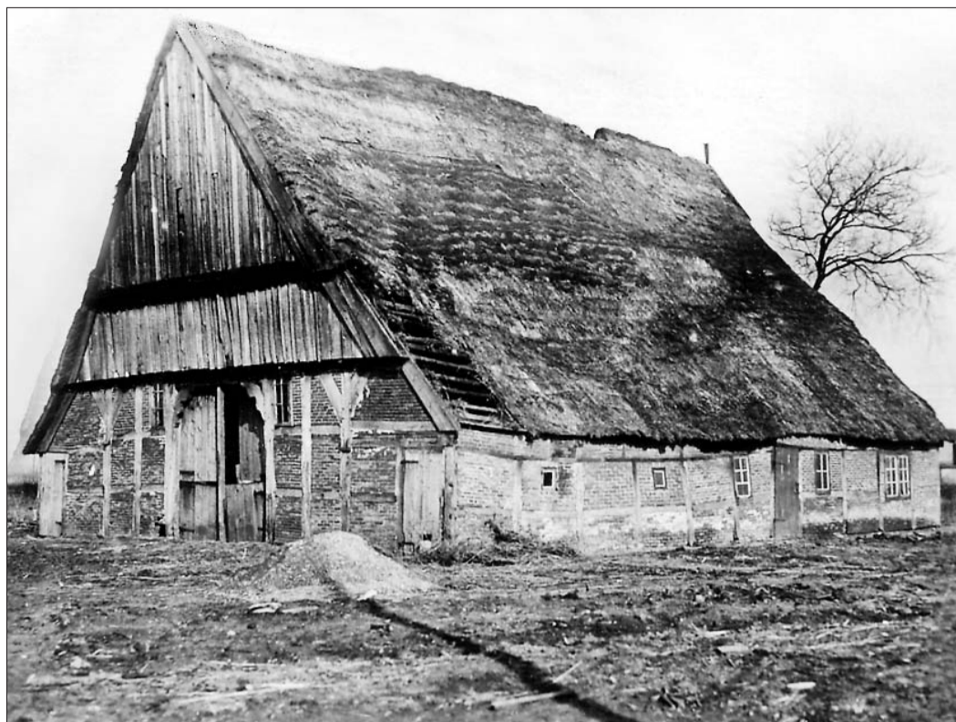
Foto der Brinkkate, ein typisches Haus einer kleinen Esinger Bauernstelle, wie sie jahrhundertlang ausgesehen haben (Grundriss des Hauses siehe unten).

Esingen, das Urdorf der Stadt Tornesch, ist im Jahr 1285 in einer Schenkungsurkunde von Heinrich IV. von Barmstede an das Kloster Uetersen erstmalig urkundlich erwähnt worden. Somit begeht Esingen in diesem Jahr seine 725-Jahrfeier. Doch ist das Dorf, von dem 1285 Nutzungsrechte an das Kloster Uetersen verschenkt worden sind, schon älter.