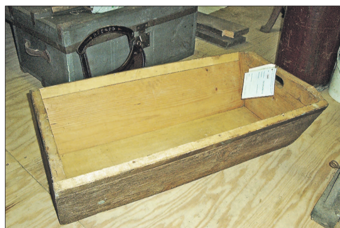
Backtröge gehörten zu den wertvollen Gegenständen der Höfe, weil das zu ihrer Herstellung notwendige Eichenholz nicht frei zu schlagen war, sondern aus der königlichen Hölzung des Esinger Wohldes ausgewiesen und bezahlt werden musste. Exemplar des Volkskundlichen Museums der Kulturgemeinschaft in Esingen.

Das verwaltungsmäßig zu Esingen gehörende Dorf Ahrenlohe entstand ab dem ausgehenden 17. Jahrhundert. Der erste Ahrenloher Hof war ein am alten Ochsenweg, der heutigen Ahrenloher Straße, gelegenes Gehöft, heute im Besitz der Familie Hatje. Auf dem Gebiet von Asperhorn, mittlerweile umgewandelt zum Gewerbepark Oha, entstanden durch Rodungen weitere Ahrenloher Siedlerstellen. Die Ländereien der neuen Ahrenloher Ansiedlungen lagen direkt um die Hofgebäude, so dass eine weit voneinander abgelegene Streusiedlung entstand.