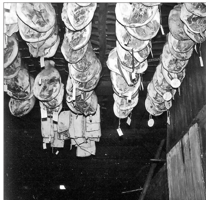
Die Fleischvorräte haben ständig im Rauch gehangen. Noch bis etwa 1962 wurden Speck und Schinken im Esinger Rauchhaus Kaland unter das Dach gehängt. Foto von 1960, Lisa Knoop.

Die in den Jahren nach der Reformation ausgewiesenen Landstellen, das betraf alle Ahrenloher Hofstellen aber auch die östliche Erweiterung Esin-